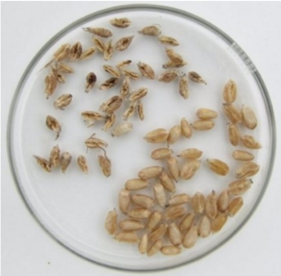
Billede 3. Sunde kerner - henholdsvis kerner, der har været angrebet af orange-gule hvedegalmyg (øverst til venstre).