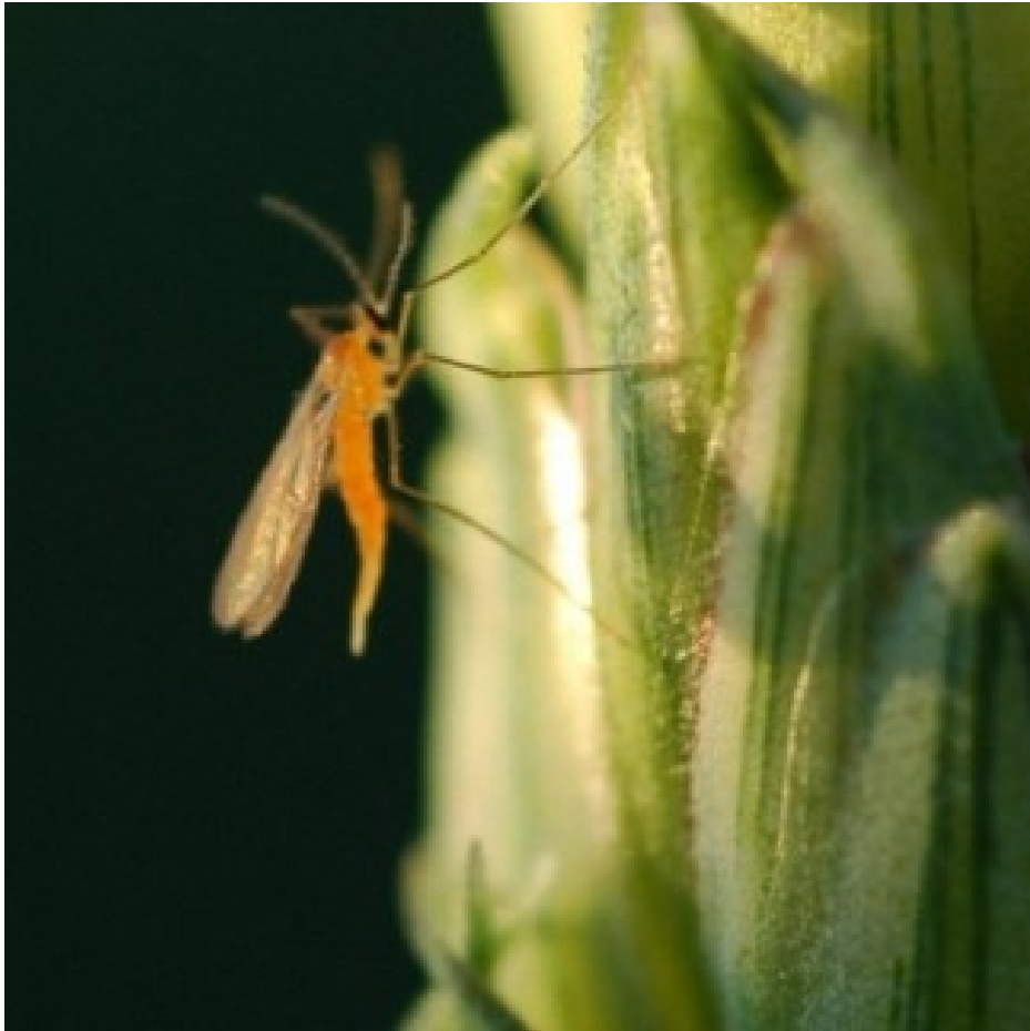
Billede 1. Hun af orange-gul hvedegalmyg i hvedeaks. Hunnen er ved at gøre klar til at lægge æg med bagkroppen.