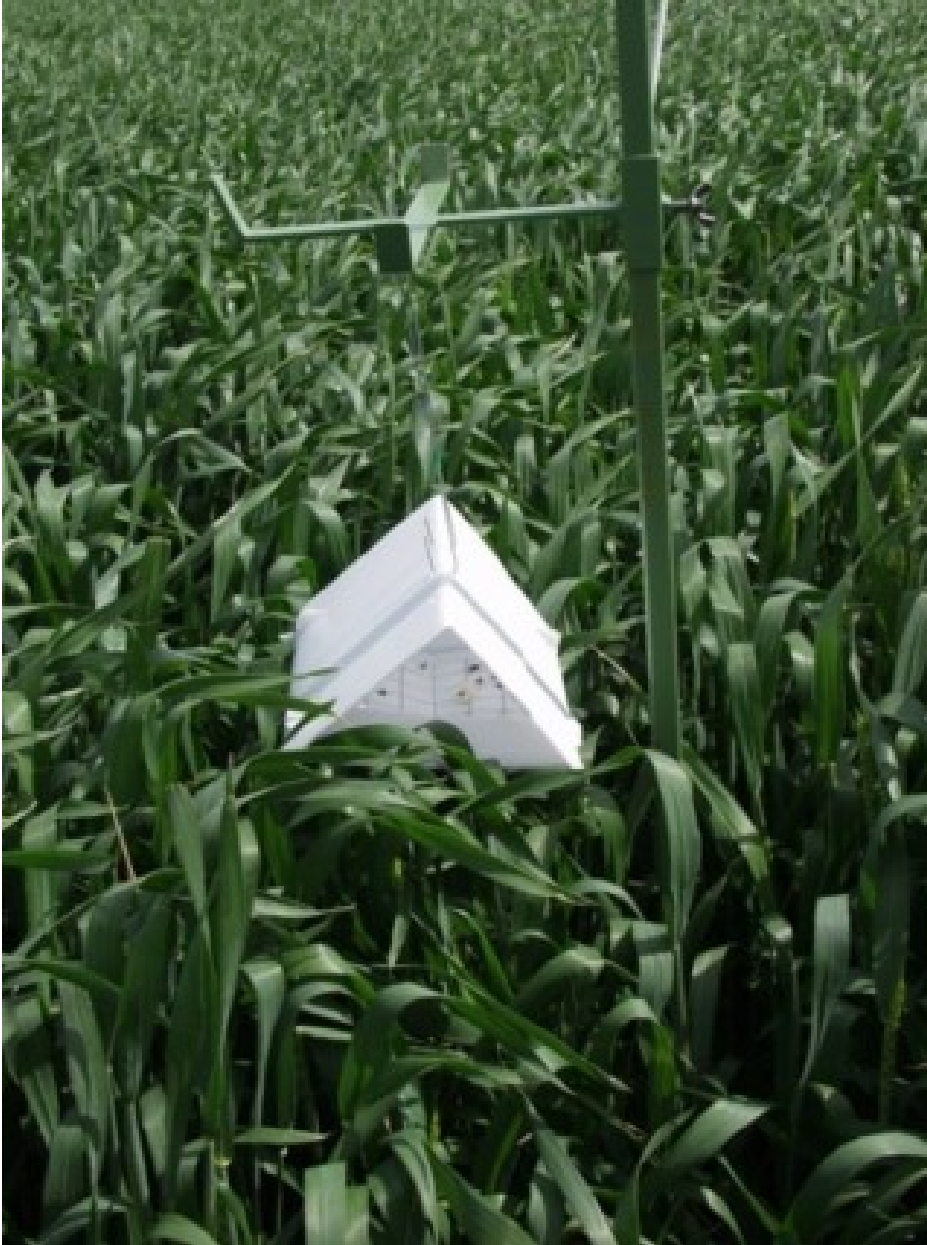
Billede 5. Feromonfælde til at følge forekomsten af orange-gule hvedegalmyg.